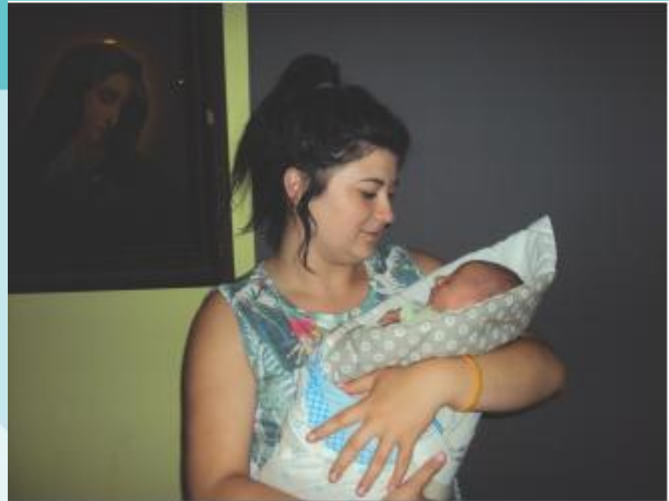
Fot. Julia Rusin, Konkurs fotograficzny EXCEPT

„założyliśmy rodzinę i już wtedy to można powiedzieć, że jest się dorosłym(...)Zaczyna być człowiek odpowiedzialny za kogoś jeszcze. To jest duży skok bym powiedziała. Tylko, że dziecko w odpowiednim momencie i w odpowiednim wieku(...)” (Marzena, F, 30, HE, PE)